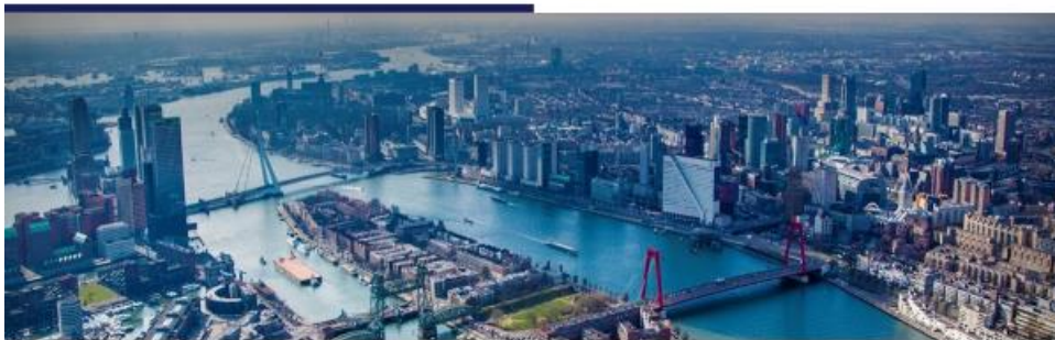
RSM - a force for positive change

De civil society bestaat uit georganiseerde burgers die gezamenlijk in vrijwillige niet-op-winst-gerichte organisaties, betaald en onbetaald, verantwoordelijkheid nemen voor iets in het publieke domein. Ze doen dat binnen andere spelregels dan de markt of overheid en bieden daarmee compensatie voor overheids- en marktfalen. Nederland heeft een van de grotere civil societies van de wereld, bijvoorbeeld door ons bijzonder onderwijs en de publieke omroep. Of eigenlijk andersom, de Nederlandse overheid doet bijna niks. Ze financiert wel veel zoals het bijzonder onderwijs, de stichting welzijn, het buurthuis en de speeltuinvereniging. In de civil society kunnen drie verschillende organisaties onderscheiden worden naar hun doelstelling. En dat is relevant voor Rotary.